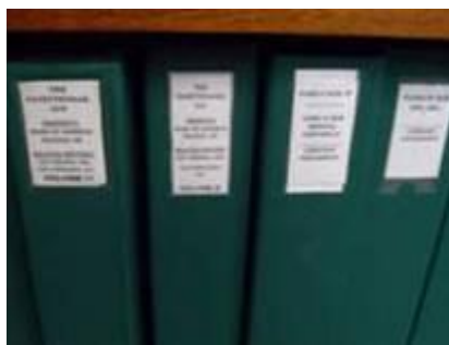
) Objektakten im Archiv