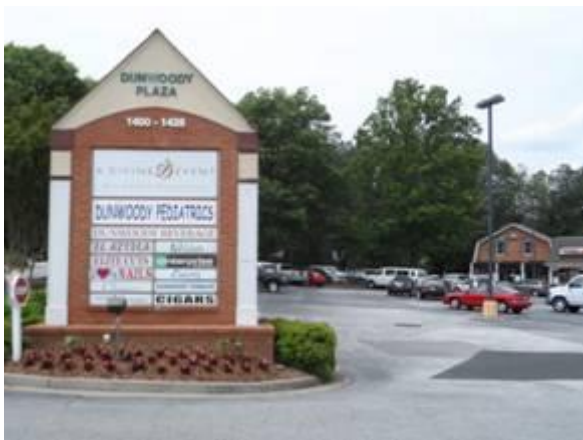
Einfahrt zur Dunwoody Mall

Zusammen mit Kollegen habe ich mir Immobilien in Atlanta, Dunwoody, Sandy Springs, Rome (alle Georgia), Chattanooga (Tennessee) und in Jacksonville und Fernandina Beach (beide Florida) angesehen. Beispielhaft für die Wertsteigerung der Immobilien möchte ich das „Neighborhood-Center“ Dunwoody Plaza (aus dem Fonds III) anführen. Mieter ist dort eine erfolgreiche Kinderarztpraxis. Der Kinderarzt hat einen Chirurgen angezogen, der jetzt in die Nachbarräumlichkeiten einzieht, die Umbauten sind im Gange und die Miete wird sich von USD 9 auf USD 19 pro „square feet“ erhöhen.