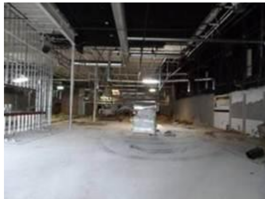
Umbau chirurgische Praxis