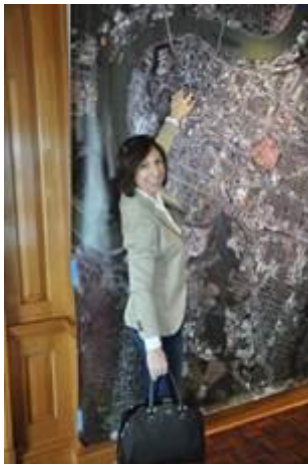
Vor Ort in Chattanooga