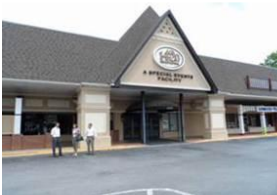
Eingang zur neuen chirurgischen Praxis