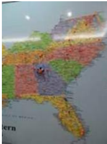
Investitionsstandorte der TSO Objekte

Ein Großteil der Immobilien liegt im Großraum Atlanta. Die Stadt wächst rasant, was sie für Immobilieninvestitionen besonders attraktiv macht.