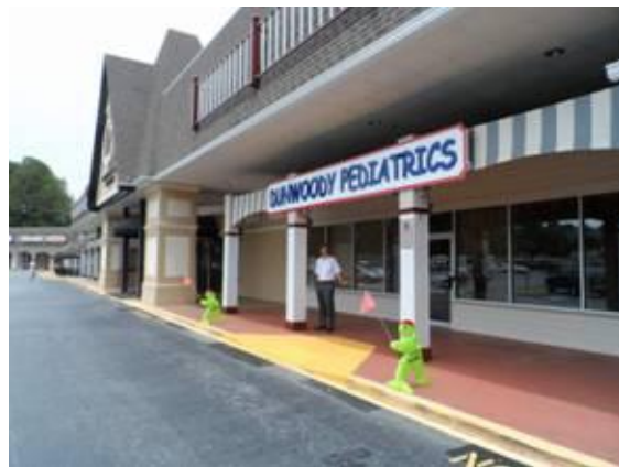
Kinderarztpraxis in der Dunwoody Mall